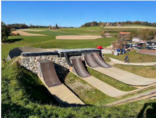
Sauts avec réception sur airbag