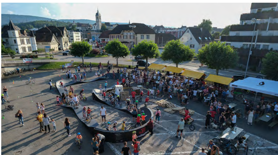
Inauguration du pumptrack mobile à Porrentruy le 3 septembre 2021

Les dépenses ont été réalisées pour l'achat du pumptrack mobile, la conception du projet du Jura Bike Park et la communication.