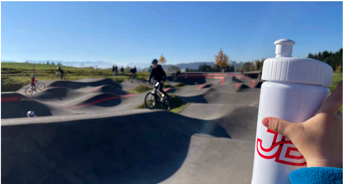
Pumptrack du Swiss Bike Park

Les autres pistes du Jura Bike Park seront de parfaits terrains d'entraînement pour le VTT enduro et cross-country.