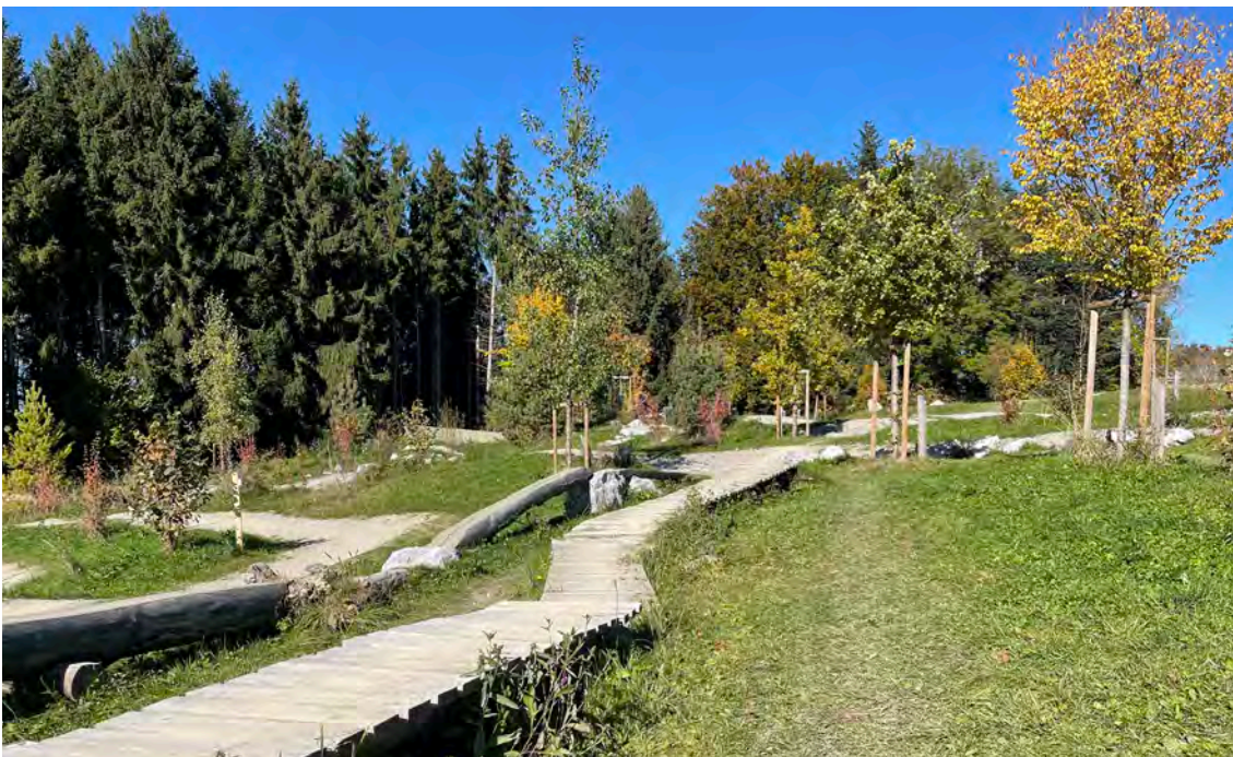
Skilltrail du Swiss Bike Park

Ces points figurent dans le cahier des charges du projet.