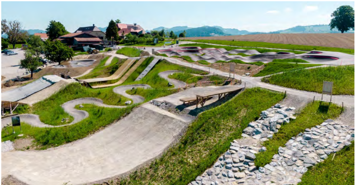
Swiss Bike Park Oberried avec son pumptrack en arrière-plan

Le bike park de référence en Suisse se trouve à Oberried, dans le canton de Berne. Le Swiss Bike Park s'étend sur une surface de 30'000 m 2 et comporte de multiples zones d'activités liées au vélo. Cinq personnes sont engagées à l'année pour gérer cette infrastructure. Des compétitions, des camps, des formations, des sorties d'entreprises, des démonstrations, des présentations de matériel et divers événements y sont organisés tout au long de l'année. Le Swiss Bike Park est la source d'inspiration de notre projet.