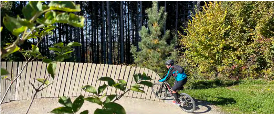
Flowtrail du Swiss Bike Park

La promotion de la sécurité routière et de la mobilité douce