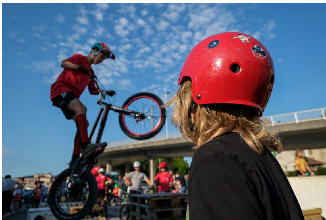
Démonstration de vélo trial lors de l'inauguration du pumptrack mobile

Certaines zones seront praticables par les personnes à mobilité réduite munies d'un véhicule adapté.