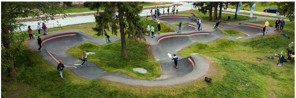
Exemple de pumptrack

L'infrastructure phare d'un bike park est généralement son pumptrack, une piste en asphalte avec des creux, bosses et virages relevés. Le premier pumptrack a été construit en 2009 à Jenaz, près de Davos. En Suisse, plus de 80 pumptracks sont répertoriés à ce jour, dont seulement 12 en Romandie et aucun dans le canton du Jura. Le pumptrack le plus proche est celui de La Neuveville. Les pistes de pumptrack connaissent un très fort engouement en Suisse et dans le monde, notamment parce qu'elles sont ouvertes à tous les pratiquants, qu'ils soient novices ou experts, jeunes ou plus âgés, cyclistes ou amateurs de trottinettes, skateboards ou patins à roulettes.