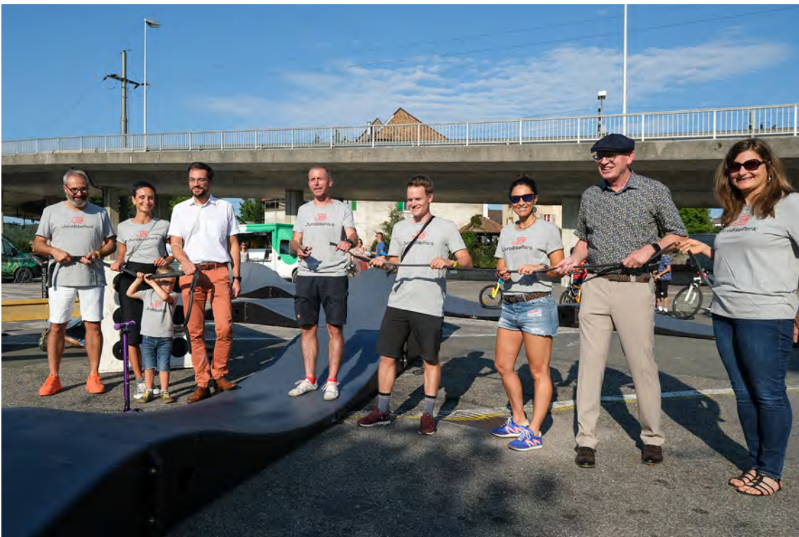
Inauguration du pumptrack mobile à Porrentruy en compagnie du Ministre Martial Courtet et du Maire de Porrentruy, Gabriel Voirol

DU PLAISIR PAR LE MOUVEMENT, LA DEVISE DE LA FONDATION JURA BIKE PARK !